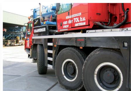
Pneumatiky Magna 16.00R25 MA03 v aplikácii na mobilnom žeriave

B. V. Odvtedy si pneumatiky Magna už úspešne získavajú obľubu aj v blízkom zahraničí užívatelmi stavebnej či banskej mechanizácie, ako napríklad: Heidelberg Cement, Lafarge Cement, Strabag AG, Wienerberger, DUFONEV R.C., a.s., KAMENOLOMY ČR s.r.o., GRANITA s.r.o., OKD, Doprava, akciová spoločnosť. Svoje miesto si už začínajú nachádzať aj u slovenských zákazníkov, medzi ktorých patria: PASELL SLOVAKIA s.r.o., Smrečina Hofatex, a.s., SMZ, a.s. Jelšava, Calmit, spol. s.r.o.