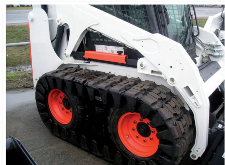
Pásy obuté priamo na kolesách šmykom riadeného nakladača

s výrobou gumových pásov zaručuje spoločnosť GTW miesto popredného svetového výrobcu pásov. Predovšetkým to je ich produkt - revolučný pás J'Track , ktorý použitím vnútorného kordu, ktorý je vyrobený bez spojov, z jedného kusu oceľových vrstiev - robí pás silnejším a odolnejším.